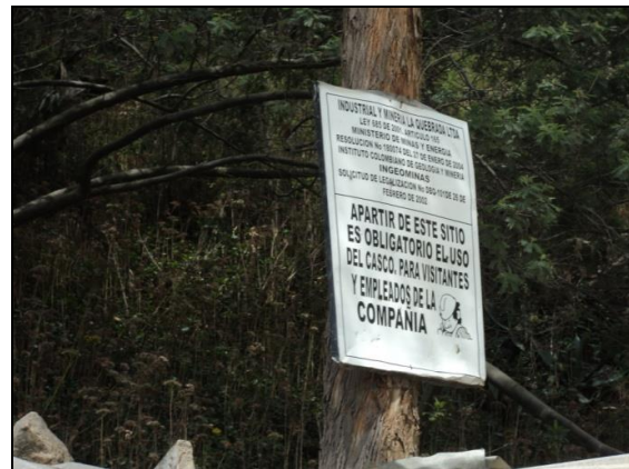
Fotografías Nos. 9 y 10. Sociedad Industrial y Minera La Quebrada Ltda. En Liquidación. Se aprecian señales que se encuentran en el predio objeto del PMRRA.

La Sociedad Industrial y Minera la Quebrada Ltda. En Liquidación ha llevado a cabo la plantación de ocho (8) individuos de Eucaliptus globulus dentro de la Zona de Manejo y Preservación Ambiental- ZMPA de la Quebrada Limas, esta especie exótica no es recomendada para la recuperación de áreas y no se encuentra dentro del Protocolo Distrital de Restauración.