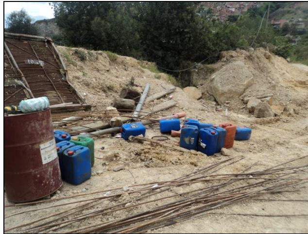
Fotografía No. 15. Sociedad Industrial y Minera La Quebrada Ltda. En Liquidación. En el predio se observa la forma desordenada sin señalización donde se dispone algunos materiales.

Dentro del predio, no se observa la implementación de puntos ecológicos para depositar los desechos, al contrario se aprecian residuos de todo tipo de elementos dispuestos de forma inadecuada